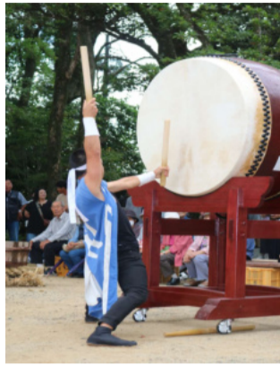
勇壮な太鼓の演奏

前夜祭は11組の演者が出場。午後6時から午後7時30分まで、保育園児の踊り、太鼓、中学生によるダンス(3組出場)、舞踊、マジックショー、中国琵琶演奏、よさこい・うき神楽、歌など様々な出し物で賑わいました。