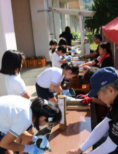
製作に集中する4年生

皆様のご協力で目標の300万円を達成しました。ありがとうございます。11月15日(金)までになっています。ご協力いただける方は、よろしくお願いたします。目標額を超えた分は、学校整備に活用しようと考えています。