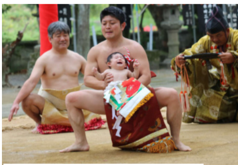
思わず泣き出す赤ちゃん土俵入り

しました。可愛らしい神輿の後には秀岳館高校生の雅太鼓の演奏です。境内に響く「ドン!」邪気払いの如く脳天に心地よく響き、煩惱も吹き飛んだ様な気分です。太鼓部の人数が今年14人で、去年の40人から大幅に減少して、来年以降の出演は難しいかもしれないとのことでした。