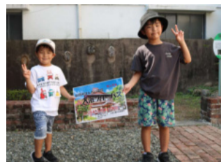
優勝した渡辺のき君りと君兄弟

土日に開店した織屋の駄菓子屋さんは、婦人会の協力で昔子供のおぼさん達が楽しみました。「街並み再発見」では、金剛からのお子さん連れのご夫婦が、一か月入浴券をゲット。池田山