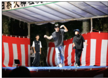
中学生によるダンス

15日の本祭は、朝9時からの厳かな神事に始まり、保育園児の奉納神輿を皮切りにスタート