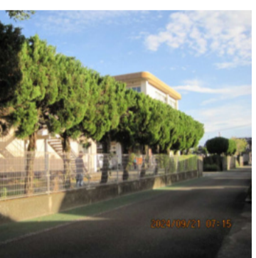
きれいに剪定された生垣

除草は予定時間内に出来ました。樹木剪定は高所作業でした。予想以上に木々が繁っていて、転えらるる事でしょう。